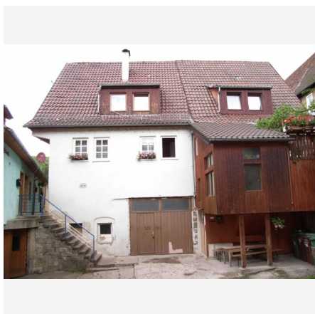
Bildbeschreibung: Nebengebäude 49/1