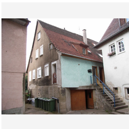
Bildbeschreibung: Giebelseite von Osten