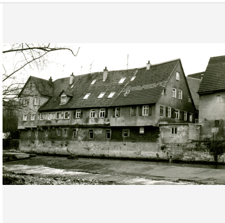
Bildbeschreibung: Ansicht von Norden